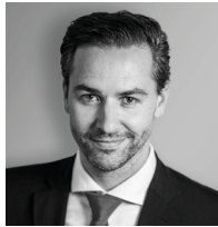
Mag. Johannes Klaus Wiener Börse AG